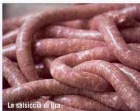
La salisiccia di Bra