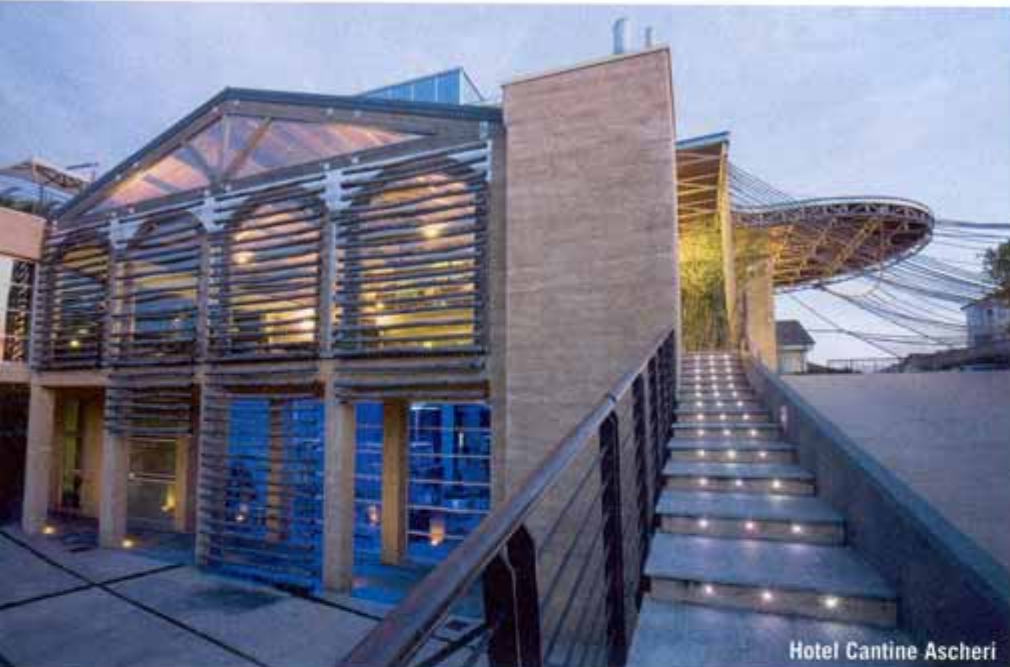
Hotel Cantine Ascheri