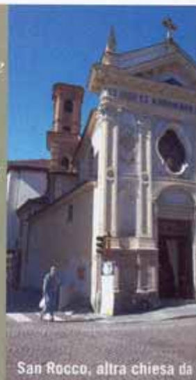
San Rocco, altra chiesa da v

Da non perdere 1. I due corsi sovrapposti 2. La chiesa rococò di Santa Chiara 3. Pollenzo 4. La salsiccia di Bra, da mangiare cruda